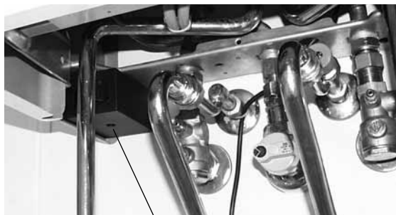
Adaptér trojcestného prepínacieho ventilu

Montáž adaptéra trojcestného prepínacieho ventilu spočíva hlavne v pripevnení magnetu na montážnu platňu. Ak tomu bráni obojstranné porúrovanie, môže sa adaptér trojcestného prepínacieho ventilu umiestniť na inom mieste plynového kotla. Treba pritom podľa možnosti zohľadniť, aby bol adaptér vzdialený od horáka čo najďalej a vystavený nízkym teplotám.